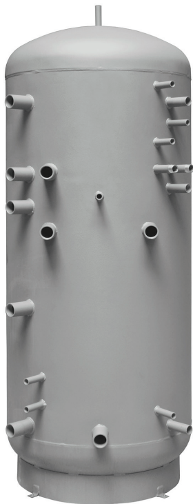
HSK 1000 P s izolací