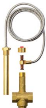
Provedení s odnímatelnou kapilárou