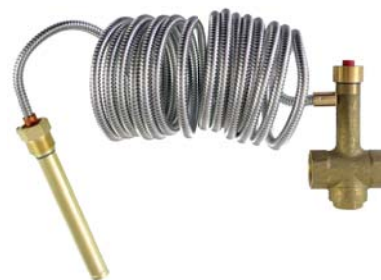
Provedení s 4m kapilárou